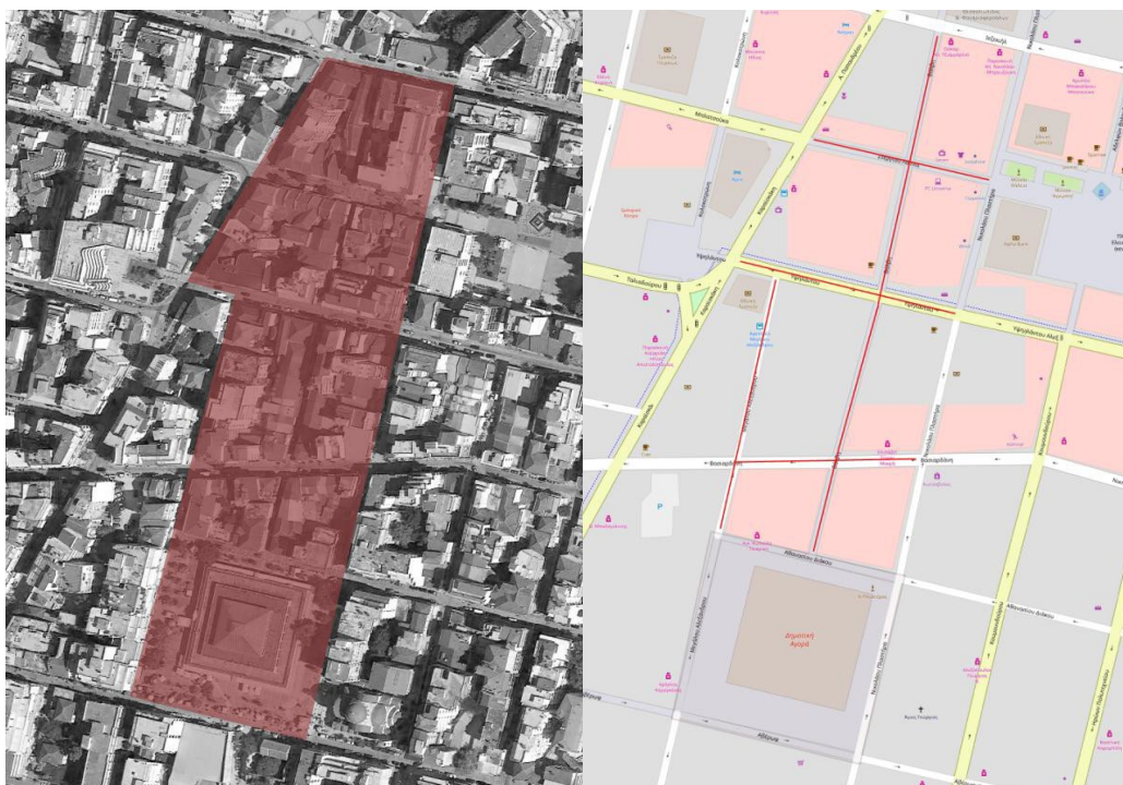
ΕΙΚΟΝΑ 2. ΠΕΡΙΟΧΗ ΜΕΛΕΤΗΣ ΚΑΙ ΕΠΕΜΒΑΣΕΩΝ

Στόχος της αναβάθμισης της περιοχής μελέτης είναι η μεγαλύτερη προσέλκυση αγοραστικού κοινού στην εν λόγω περιοχή, με σκοπό την ενίσχυση της τοπικής αγοράς και κατ' επέκταση και της οικονομίας της εγγύς και της ευρύτερης περιοχής.