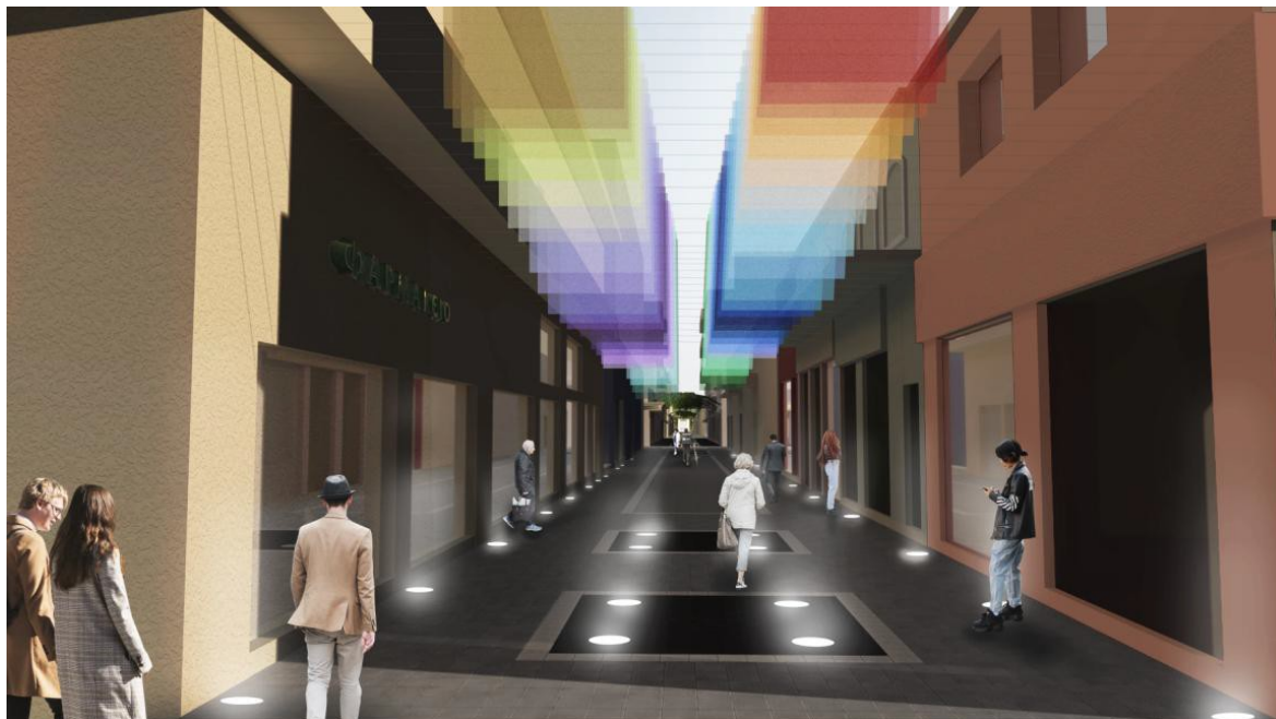
ΕΙΚΟΝΑ 4. ΦΩΤΟΡΕΑΛΙΣΤΙΚΗ ΑΠΕΙΚΟΝΙΣΗ ΠΡΟΤΕΙΝΟΜΕΝΩΝ ΠΑΡΕΜΒΑΣΕΩΝ ΤΜΗΜΑ 1 ΤΟΥ ΠΕΖΟΔΡΟΜΟΥ ΒΑΛΒΗ

τους θερινούς μήνες. Ο συνδυασμός της εικαστικής εγκατάστασης με την τοποθέτηση των νέων φωτιστικών σωμάτων στη βάση του οριζόντιου επιπέδου κυκλοφορίας, αλλά και την αντικατάσταση των υπαρχόντων φθαρμένων φωτιστικών, καθιστά την πρόταση ολοκληρωμένη τόσο από αισθητικής όσο και από λειτουργικής πλευράς, καθώς θα αποτελεί το «κάλεσμα» για μια ευχάριστη και πολύχρωμη διαδρομή, όπως απεικονίζεται φωτορεαλιστικά και παρακάτω.