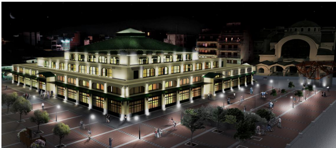
ΕΙΚΟΝΑ 23. ΦΩΤΟΡΕΑΛΙΣΤΙΚΗ ΑΠΕΙΚΟΝΙΣΗ ΦΩΤΙΣΤΙΚΗΣ ΠΡΟΤΑΣΗΣ ΤΟΥ ΚΤΙΡΙΟΥ ΤΗΣ ΔΗΜΟΤΙΚΗΣ ΑΓΟΡΑΣ

Το κτίριο της Αγοράς με το πέρασμα των χρόνων χρήζει εργασιών συντήρησης αλλά και ανάδειξής του. Πιο συγκεκριμένα, επιβάλλεται η συντήρηση των χρωματισμών του κτιρίου τόσο εξωτερικά όσο και εσωτερικά, καθώς επίσης και ο φωτισμός των εξωτερικών όψεων του κτιρίου ούτως ώστε να αναδειχθεί ο όγκος του και η επιβλητική «παρουσία» του στο χώρο της πόλης μιας και με βάση τη σημερινή εικόνα περνάει σχετικά απαρατήρητη τις νυχτερινές ώρες. Η φωτιστική ανάδειξη του κτιρίου θα τονίσει την ογκοπλασία του, τονίζοντας και τη σημασιολογία του κτιρίου για την ιστορία τόσο της πόλης όσο και του ίδιου του οικοδομήματος.