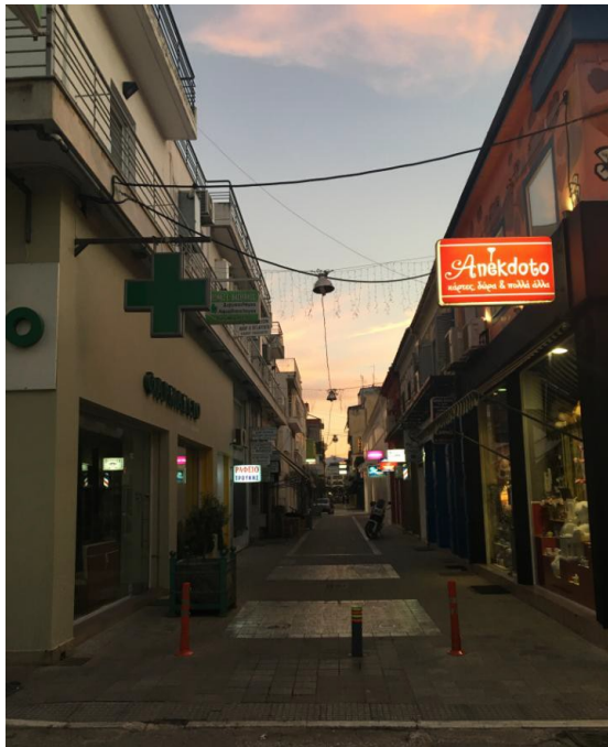
ΕΙΚΟΝΑ 3. ΣΗΜΕΡΙΝΗ ΚΑΤΑΣΤΑΣΗ ΤΜΗΜΑΤΟΣ 1 ΤΟΥ ΠΕΖΟΔΡΟΜΟΥ ΤΗΣ ΒΑΛΒΗΣ

Στο βορειότερο τμήμα του πεζοδρόμου της Βάλβη η σημερινή εικόνα παρουσιάζει μια σταθερή κινητικότητα λόγω της άμεσης γειτνίασής του και με το Δικαστικό Μέγαρο αλλά και με τον κεντρικό πεζόδρομο της Στ. Λάππα, ο οποίος αποτελεί βασικό άξονα κίνησης των πεζών προς όλες τις κατευθύνσεις. Η ύπαρξη εμπορικών καταστημάτων αλλά και υπηρεσιών επιβάλλουν την αισθητική ανάπλαση του συγκεκριμένου τμήματος πεζοδρόμου.