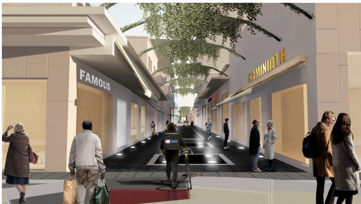
ΕΙΚΟΝΑ 6. ΦΩΤΟΡΕΑΛΙΣΤΙΚΗ ΑΠΕΙΚΟΝΙΣΗ ΠΡΟΤΕΙΝΟΜΕΝΩΝ ΠΑΡΕΜΒΑΣΕΩΝ_ΤΜΗΜΑ 2 ΤΟΥ ΠΕΖΟΔΡΟΜΟΥ ΤΗΣ ΒΑΛΒΗ