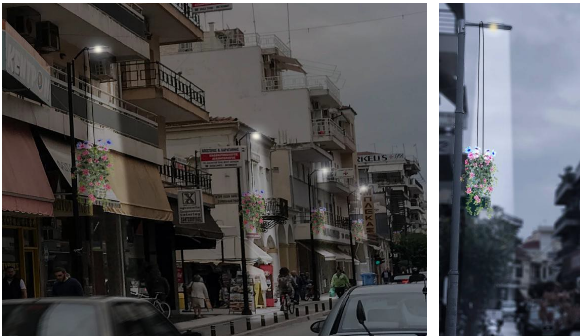
ΕΙΚΟΝΑ 19. ΦΩΤΟΡΕΑΛΙΣΤΙΚΗ ΑΠΕΙΚΟΝΙΣΗ - ΛΕΠΤΟΜΕΡΕΙΑ ΠΡΟΤΕΙΝΟΜΕΝΗΣ ΠΑΡΕΜΒΑΣΗΣ ΕΠΙ ΤΗΣ ΟΔΟΥ ΥΨΗΛΑΝΤΟΥ

Για το λόγο αυτό, προτείνεται η εισαγωγή του φυσικού στοιχείου με τη μορφή εναέριων παρτεριών, τα οποία θα είναι αναρτημένα στους υπάρχοντες ιστούς δημοτικού φωτισμού, ενώ παράλληλα προτείνεται η αντικατάσταση των πλακών των πεζοδρομίων και η αντικατάσταση των επίσηλων κάδων απορριμάτων με νέους κυλινδρικού τύπου προκειμένου να υπάρξει μια πιο ολοκληρωμένη αισθητική αναβάθμιση στο συγκεκριμένο μέτωπο της οδού.