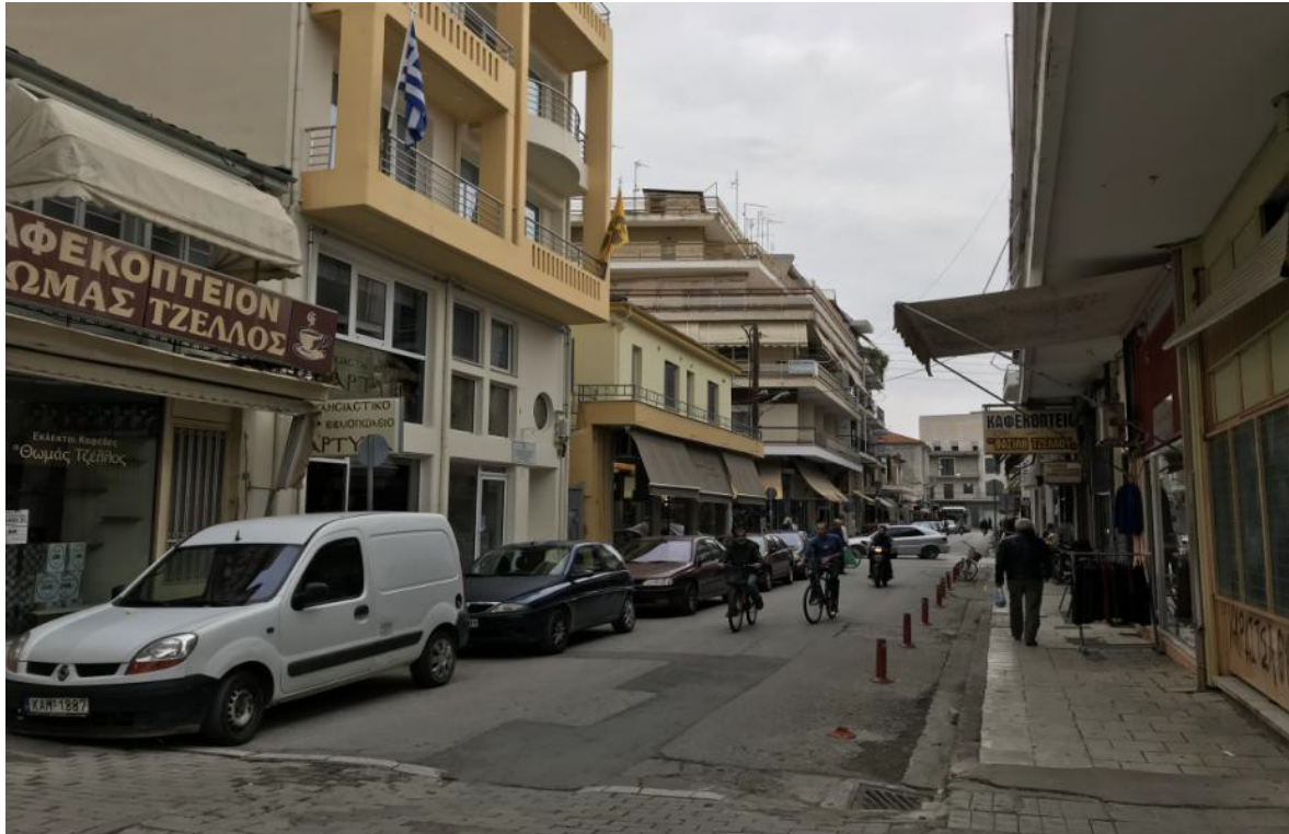
ΕΙΚΟΝΑ 12. ΥΦΙΣΤΑΜΕΝΗ ΚΑΤΑΣΤΑΣΗ ΟΔΟΥ Μ. ΑΛΕΞΑΝΔΡΟΥ(ΝΟΤΙΑ ΑΠΟΨΗ)

Για τους παραπάνω λόγους, στο συγκεκριμένο τμήμα προτείνεται η ολοκληρωτική αστική ανάπλαση με πεζοδρόμηση της οδού, προκειμένου να διευρυνθεί το χωρικό πεδίο της πλατείας της Δημοτικής Αγοράς, καθιστώντας το συγκεκριμένο τμήμα ελκυστικότερο τόσο για την προσπέλασή του όσο και για την ανάδειξη των καταστημάτων που βρίσκονται στα δυο μέτωπα της οδού. Πιο συγκεκριμένα, η πεζοδρόμηση θα ακολουθήσει το μοτίβο του δαπέδου της υπόλοιπης πλατείας της Αγοράς με ψυχρά υλικά, την κατασκευή παρτεριών με περιμετρικά καθιστικά φωτιζόμενα στη βάση τους, προκειμένου να εισαχθεί και σ αυτόν τον χώρο το στοιχείο του πρασίνου, ιστούς φωτισμού και κάδους απορριμμάτων για λειτουργικούς λόγους, όπως παρουσιάζεται στην παρακάτω φωτορεαλιστική απεικόνιση.