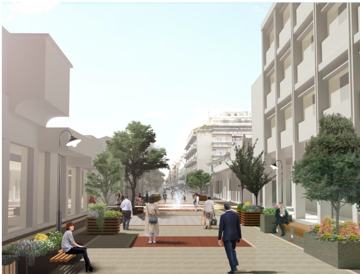
ΕΙΚΟΝΑ 15. ΠΡΟΤΕΙΝΟΜΕΝΕΣ ΠΑΡΕΜΒΑΣΕΙΣ ΣΤΟΝ ΠΕΖΟΔΡΟΜΟ ΣΤ. ΛΑΠΠΑ

θερινούς μήνες, όπου οι θερμοκρασίες είναι ιδιαίτερα υψηλές και δυσχεραίνουν τη διέλευση από τον πεζόδρομο.