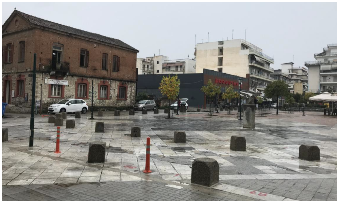
ΕΙΚΟΝΑ 27. ΤΟ ΚΤΙΡΙΟ ΤΗΣ ΠΑΛΙΑΣ ΗΛΕΚΤΡΙΚΗΣ ΣΤΗ ΝΟΤΙΟΑΝΑΤΟΛΙΚΗ ΠΛΕΥΡΑ ΤΗΣ ΠΛΑΤΕΙΑΣ ΔΗΜΟΤΙΚΗΣ ΑΓΟΡΑΣ

οποίο εναρμονίζεται αισθητικά τόσο με το επιβλητικό κτίριο της Αγοράς, όσο και με το παρακείμενο κτίριο της Παλαιάς Ηλεκτρικής, ενός κτιρίου με εξίσου μεγάλη ιστορική σημασία και βαρύτητα, αξιοποιεί με τον καλύτερο δυνατό τρόπο το κενό αυτό.