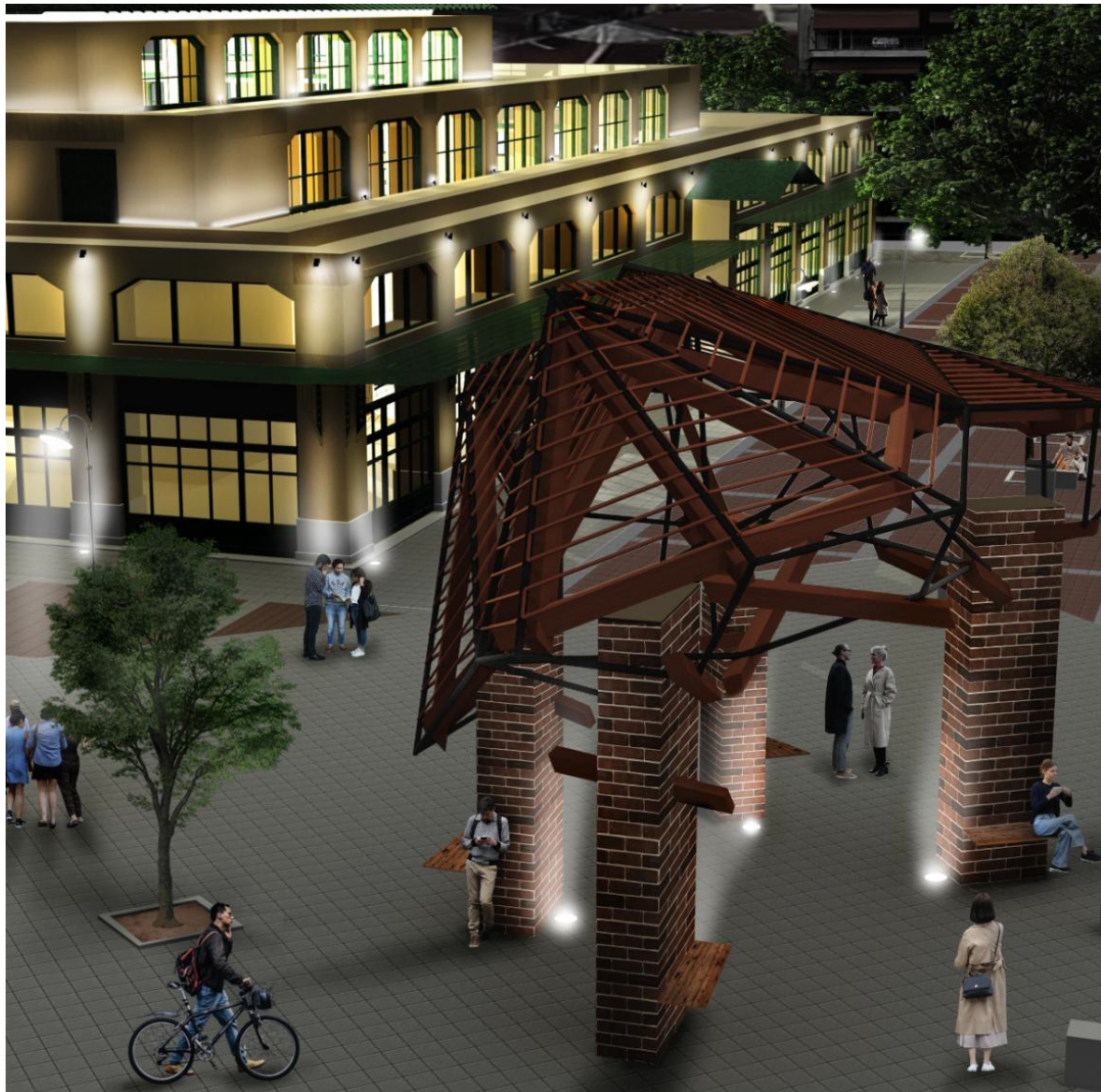
ΕΙΚΟΝΑ 28. ΦΩΤΟΡΕΑΛΙΣΤΙΚΗ ΑΠΕΙΚΟΝΙΣΗ ΠΡΟΤΕΙΝΟΜΕΝΗΣ ΚΑΤΑΣΚΕΥΗΣ ΣΤΕΓΑΣΤΡΟΥ

Ολοκληρώνοντας στο σημείο αυτό τις προτεινόμενες παρεμβάσεις στον αστικό χώρο της περιοχής μελέτης, διαπιστώνεται ότι η ανάπλαση του αστικού χώρου σε συνδυασμό με την αισθητική αναβάθμιση των όψεων των καταστημάτων, είναι ικανή και αναγκαία συνθήκη προκειμένου να προσελκύσει το αγοραστικό κοινό των καταστημάτων που βρίσκονται στη συγκεκριμένη περιοχή. Με τον τρόπο αυτό, η εμπορική κίνηση των καταστημάτων θα αποκτήσουν τη βαρύτητα και την προσοχή που μέχρι τώρα δεν είχαν σε ικανοποιητικό βαθμό, ενώ παράλληλα θα ολοκληρωθεί και το αστικό τοπίο της πόλης, προ(σ)καλώντας το κοινό να περιηγηθεί και σε μια δευτερεύουσα, μέχρι πρότινος, περιοχή αγοράς αλλά και αναψυχής.