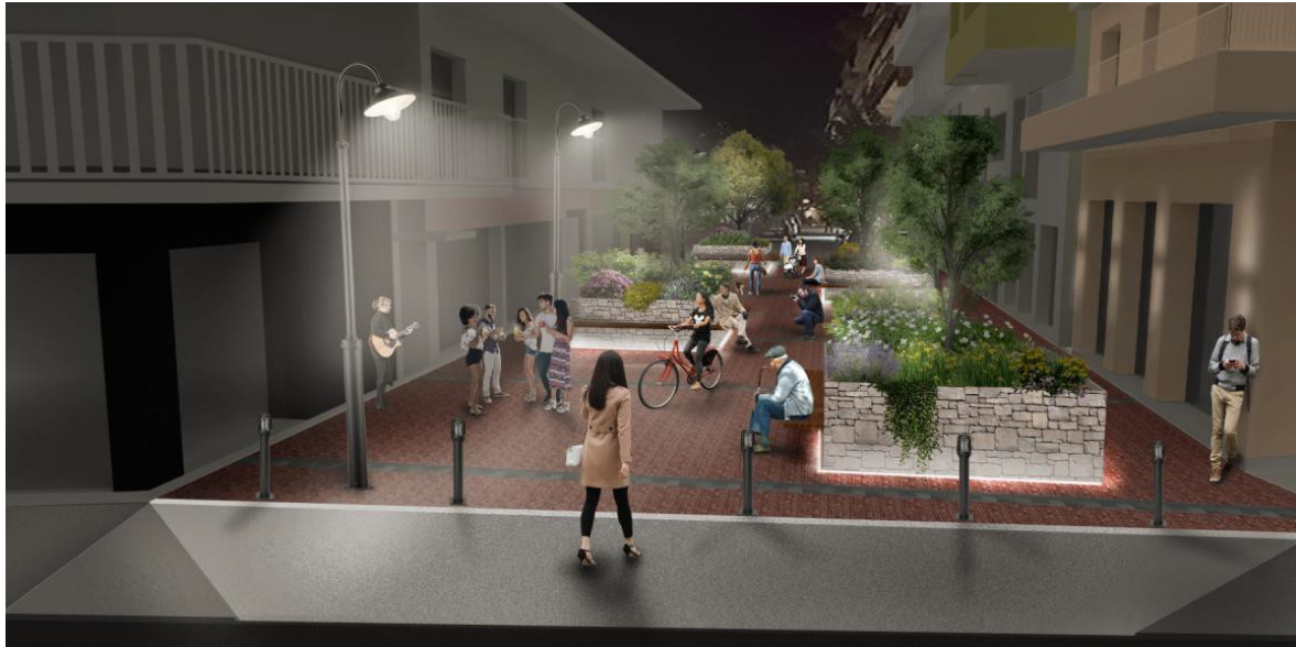
ΕΙΚΟΝΑ 13. ΦΩΤΟΡΕΑΛΙΣΤΙΚΗ ΑΠΕΙΚΟΝΙΣΗ ΠΡΟΤΕΙΝΟΜΕΝΩΝ ΠΑΡΕΜΒΑΣΕΩΝ ΕΠΙ ΤΗΣ Μ.ΑΛΕΞΑΝΔΡΟΥ (ΒΟΡΕΙΑ ΟΨΗ)