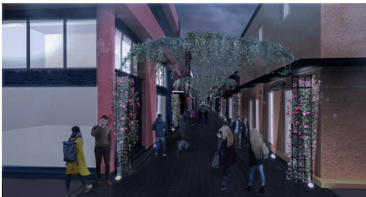
ΕΙΚΟΝΑ 9. ΦΩΤΟΡΕΑΛΙΣΤΙΚΗ ΑΠΕΙΚΟΝΙΣΗ ΠΡΟΤΕΙΝΟΜΕΝΩΝ ΠΑΡΕΜΒΑΣΕΩΝ (ΝΥΧΤΕΡΙΝΗ ΑΠΟΨΗ)