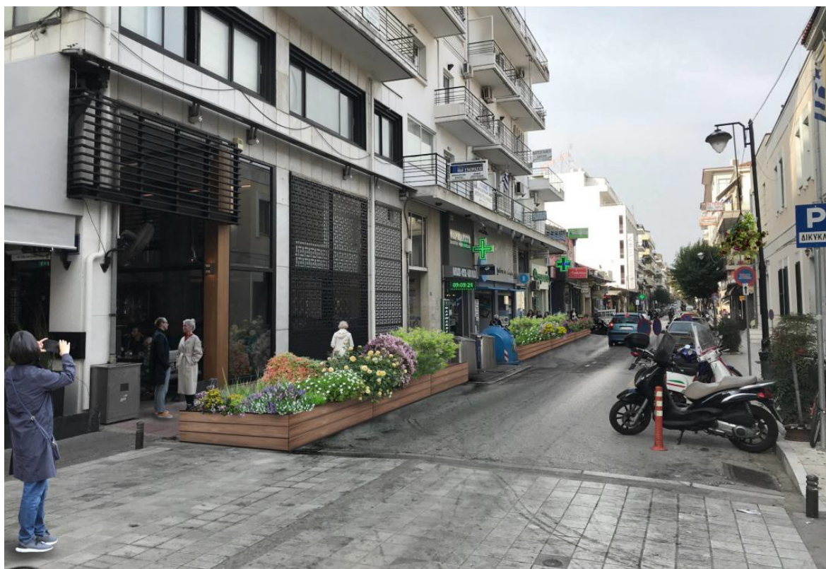
ΕΙΚΟΝΑ 21. ΦΩΤΟΡΕΑΛΙΣΤΙΚΗ ΑΠΕΙΚΟΝΙΣΗ ΠΡΟΤΕΙΝΟΜΕΝΩΝ ΠΑΡΕΜΒΑΣΕΩΝ ΕΠΙ ΤΗΣ ΟΔΟΥ ΙΕΖΕΚΙΗΛ