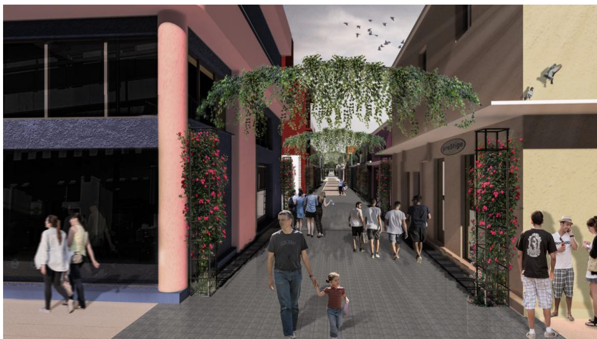
ΕΙΚΟΝΑ 8. ΦΩΤΟΡΕΑΛΙΣΤΙΚΗ ΑΠΕΙΚΟΝΙΣΗ ΠΡΟΤΕΙΝΟΜΕΝΩΝ ΠΑΡΕΜΒΑΣΕΩΝ (ΗΜΕΡΗΣΙΑ ΑΠΟΨΗ)