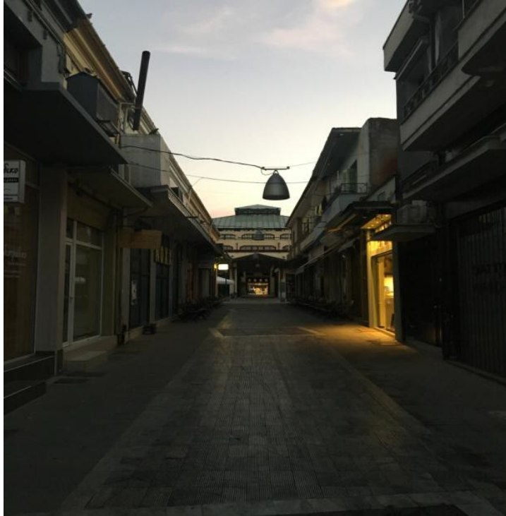
ΕΙΚΟΝΑ 10. ΥΦΙΣΤΑΜΕΝΗ ΚΑΤΑΣΤΑΣΗ ΤΜΗΜΑΤΟΣ 4 ΤΟΥ ΠΕΖΟΔΡΟΜΟΥ ΤΗΣ ΒΑΛΒΗ

Η αναβάθμιση του δημόσιου χώρου στο συγκεκριμένο τμήμα επικεντρώνεται, όπως και στο προηγούμενο, στην ανάδειξη των πλευρικών κτισμάτων και την εισαγωγή του φυσικού στοιχείου το οποίο απουσιάζει παντελώς. Ακολουθώντας το μοτίβο του προηγούμενου τμήματος, επιδαπέδια χωνευτά φωτιστικά και κατακόρυφες ανθοστήλες στο όρια του δημόσιου χώρου με τα μέτωπα των κτισμάτων, καθώς και καμπύλα τόξα που θα φιλοξενήσουν το πράσινο στοιχείο που λείπει από το οπτικό πεδίο θα μεταμορφώσουν την είσοδο και το «καδράρισμα» του επιβλητικού κτιρίου της Δημοτικής Αγοράς που δεσπόζει στο τέλος του συγκεκριμένου τμήματος του πεζοδρόμου.