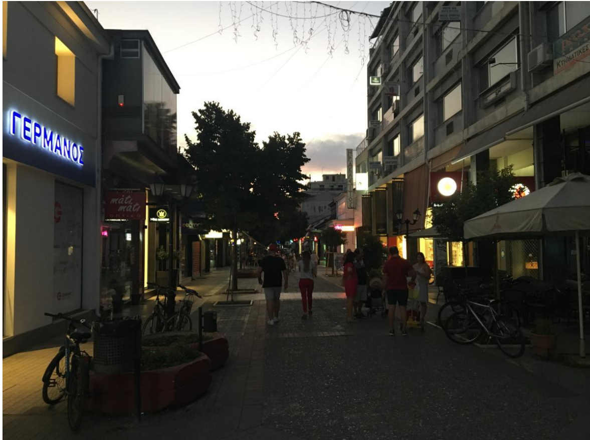
ΕΙΚΟΝΑ 14. ΥΦΙΣΤΑΜΕΝΗ ΚΑΤΑΣΤΑΣΗ ΣΤΟΝ ΠΕΖΟΔΡΟΜΟ ΤΗΣ ΣΤ. ΛΑΠΠΑ

Οι παρεμβάσεις που προτείνεται να πραγματοποιηθούν στο εν λόγω τμήμα είναι η ολοκληρωτική αντικατάσταση της επιφάνειας του πεζοδρόμου με υλικά όμοια με το κομμάτι της Πλατείας Ελευθερίας με την οποία είναι χωρικά άμεσα συνδεδεμένη, αλλά και του υπόλοιπου κεντρικού πεζοδρόμου. Τα παρτέρια και τα παγκάκια θα αντικατασταθούν με άλλα σύνθετης κατασκευής και τυπολογίας όμοιας με την ανάπλαση της Πλατείας Ελευθερίας, όπως και τα φωτιστικά σώματα. Οι λαμπτήρες των φωτιστικών θα αντικατασταθούν με νέους τύπου LED, αφενός για λόγους εξοικονόμησης ενέργειας και αφετέρου για να ενισχυθεί η ποιότητα του φωτισμού στον κεντρικό αυτό άξονα. Όλα αυτά θα πραγματοποιηθούν προκειμένου να υπάρχει μια ομοιομορφία, μια σύνδεση και μια συνέχεια, τόσο αισθητική όσο και από πλευράς συνέπειας στις χρήσεις (εμπορικές αλλά και ψυχαγωγίας) όλου αυτού του πεζοδρομημένου άξονα του κέντρου της πόλης.