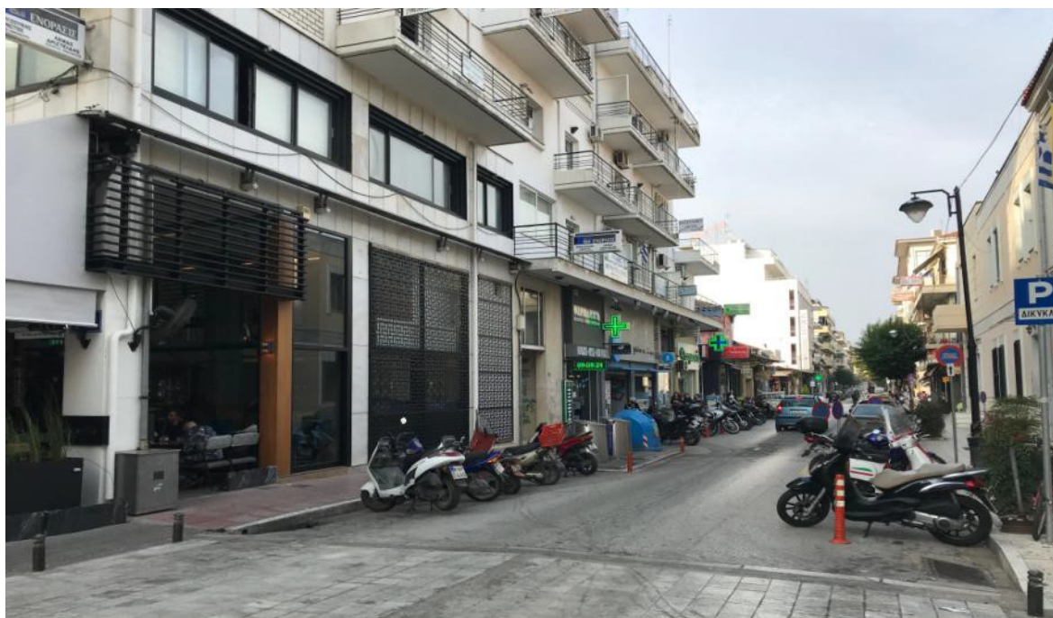
ΕΙΚΟΝΑ 20. ΥΦΙΣΤΑΜΕΝΗ ΚΑΤΑΣΤΑΣΗ ΟΔΟΥ ΙΕΖΕΚΙΗΛ (ΑΠΟΨΗ ΑΠΟ ΠΛΑΣΤΗΡΑ ΠΡΟΣ Α.ΠΑΠΑΝΔΡΕΟΥ)

Η συγκεκριμένη οδός αποτελεί το βόρειο όριο της περιοχής μελέτης η οποία οριοθετεί ταυτόχρονα και την οδό Βάλβη, που συμμετέχει στην ανάπλαση όπως παρουσιάστηκε παραπάνω. Στη συγκεκριμένη οδό συναντώνται καταστήματα, τόσο εμπορικής φύσεως, όσο και αναψυχής, αλλά και υπηρεσιών καθώς στη βόρεια παρειά της, βρίσκεται το κτίριο της Ιεράς Μητρόπολης Θεσσαλιώτιδος και Φαναριοφερσάλων. Η υφιστάμενη δομή της οδού Ιεζεκιήλ, διαθέτει ιδιαίτερα στενά πεζοδρόμια, με κάποια μικρά δέντρα να δίνουν την αίσθηση του φυσικού στοιχείου στον αστικό χώρο.