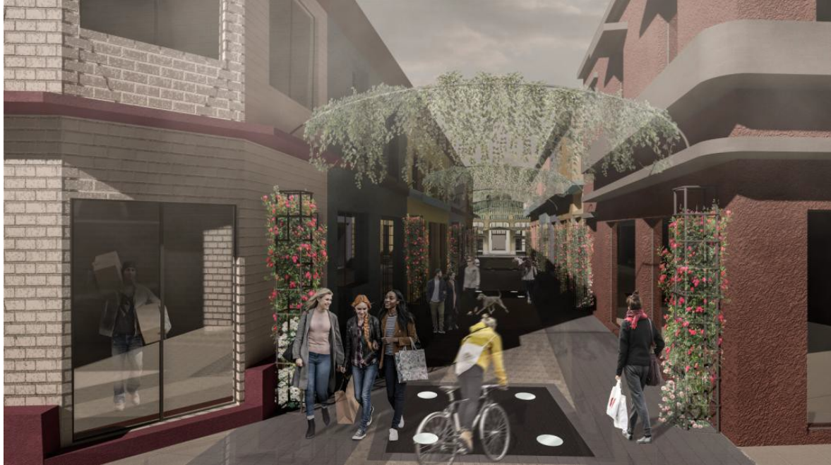
ΕΙΚΟΝΑ 11. ΦΩΤΟΡΕΑΛΙΣΤΙΚΗ ΑΠΕΙΚΟΝΙΣΗ ΠΡΟΤΕΙΝΟΜΕΝΩΝ ΠΑΡΕΜΒΑΣΕΩΝ_ΤΜΗΜΑ 4 ΤΟΥ ΠΕΖΟΔΡΟΜΟΥ ΤΗΣ ΒΑΛΒΗ

Το σημείο αυτό ολοκληρώνει την αισθητική αναβάθμιση όλου του άξονα του πεζοδρόμου της Βάλβη, με σκοπό να αυξηθεί η κινητικότητα του αγοραστικού κοινού και κατ' επέκταση η εμπορική κίνηση των καταστημάτων εντός και πέριξ αυτού.