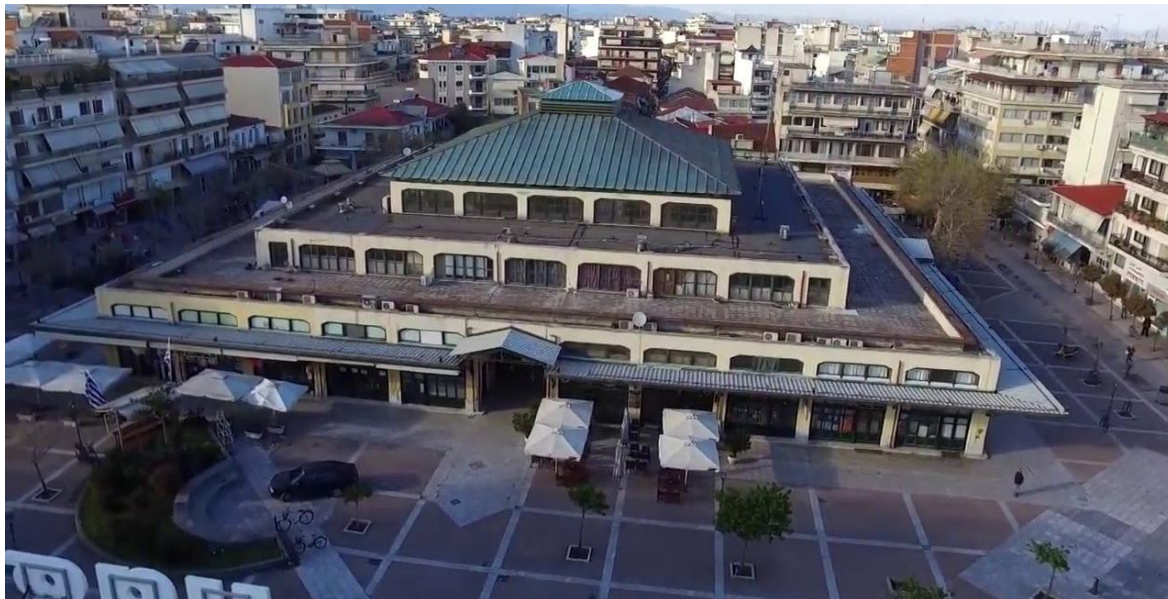
ΕΙΚΟΝΑ 22. ΝΟΤΙΑ ΠΑΝΟΡΑΜΙΚΗ ΑΠΟΨΗ ΤΟΥ ΚΤΙΡΙΟΥ ΤΗΣ ΔΗΜΟΤΙΚΗΣ ΑΓΟΡΑΣ

Το κτίριο της Αγοράς με το πέρασμα των χρόνων χρήζει εργασιών συντήρησης αλλά και ανάδειξής του. Πιο συγκεκριμένα, επιβάλλεται η συντήρηση των χρωματισμών του κτιρίου τόσο εξωτερικά όσο και εσωτερικά, καθώς επίσης και ο φωτισμός των εξωτερικών όψεων του κτιρίου ούτως ώστε να αναδειχθεί ο όγκος του και η επιβλητική «παρουσία» του στο χώρο της πόλης μιας και με βάση τη σημερινή εικόνα περνάει σχετικά απαρατήρητη τις νυχτερινές ώρες. Η φωτιστική ανάδειξη του κτιρίου θα τονίσει την ογκοπλασία του, τονίζοντας και τη σημασιολογία του κτιρίου για την ιστορία τόσο της πόλης όσο και του ίδιου του οικοδομήματος.