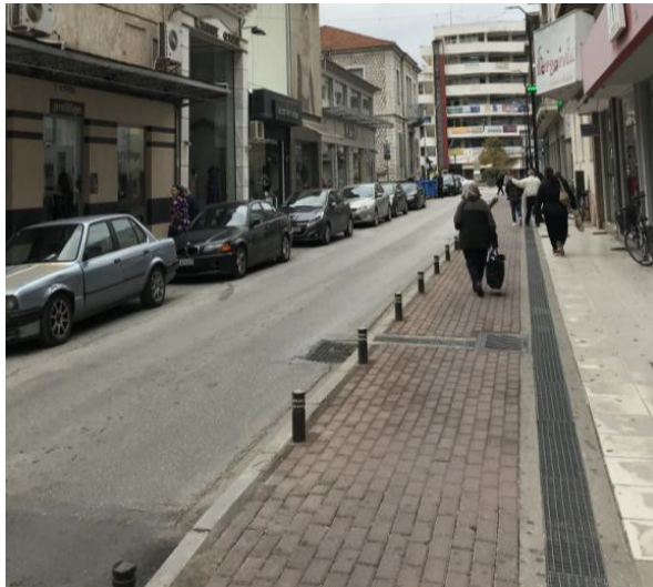
ΕΙΚΟΝΑ 17. ΥΦΙΣΤΑΜΕΝΗ ΚΑΤΑΣΤΑΣΗ ΟΔΟΥ ΥΨΗΛΑΝΤΟΥ (ΑΠΟΨΗ ΑΠΟ ΒΑΛΒΗ ΠΡΟΣ ΚΑΡΑΪΣΚΑΚΗ)