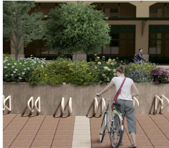
ΕΙΚΟΝΑ 25. ΦΩΤΟΡΕΑΛΙΣΤΙΚΗ ΑΠΕΙΚΟΝΙΣΗ ΠΡΟΤΕΙΝΟΜΕΝΩΝ ΠΑΡΕΜΒΑΣΕΩΝ ΣΤΗΝ ΠΛΑΤΕΙΑ ΔΗΜΟΤΙΚΗΣ ΑΓΟΡΑΣ

Στο τμήμα της πλατείας της Δημοτικής Αγοράς η υφιστάμενη κατάσταση παρουσιάζει μια σχετικά καλοδιατηρημένη εικόνα από την τελευταία αναβάθμισή της το 1998, εκτός από τις τμηματικές φθορές που υπάρχουν σε κάποια σημεία περιμετρικά τις πλατείας λόγω της διέλευσης βαρέων οχημάτων για λόγους φορτοεκφόρτωσης εμπορευμάτων. Για το λόγο αυτό, προτείνεται η αντικατάσταση των φθαρμένων στοιχείων κατά τόπους, προκειμένου να διατηρηθεί το μοτίβο του υφιστάμενου δαπέδου.