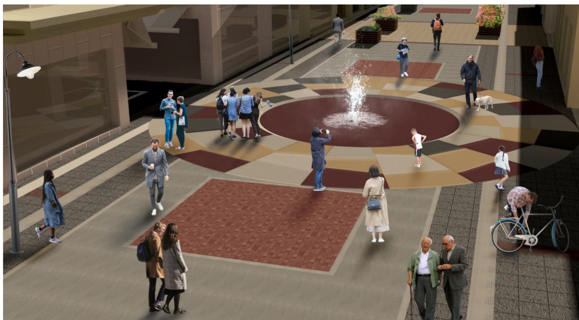
ΕΙΚΟΝΑ 16. ΦΩΤΟΡΕΑΛΙΣΤΙΚΗ ΑΠΕΙΚΟΝΙΣΗ ΠΑΡΕΜΒΑΣΕΩΝ ΣΤΗ ΣΥΜΒΟΛΗ ΣΤ. ΛΑΠΠΑ ΚΑΙ ΒΑΛΜΗ