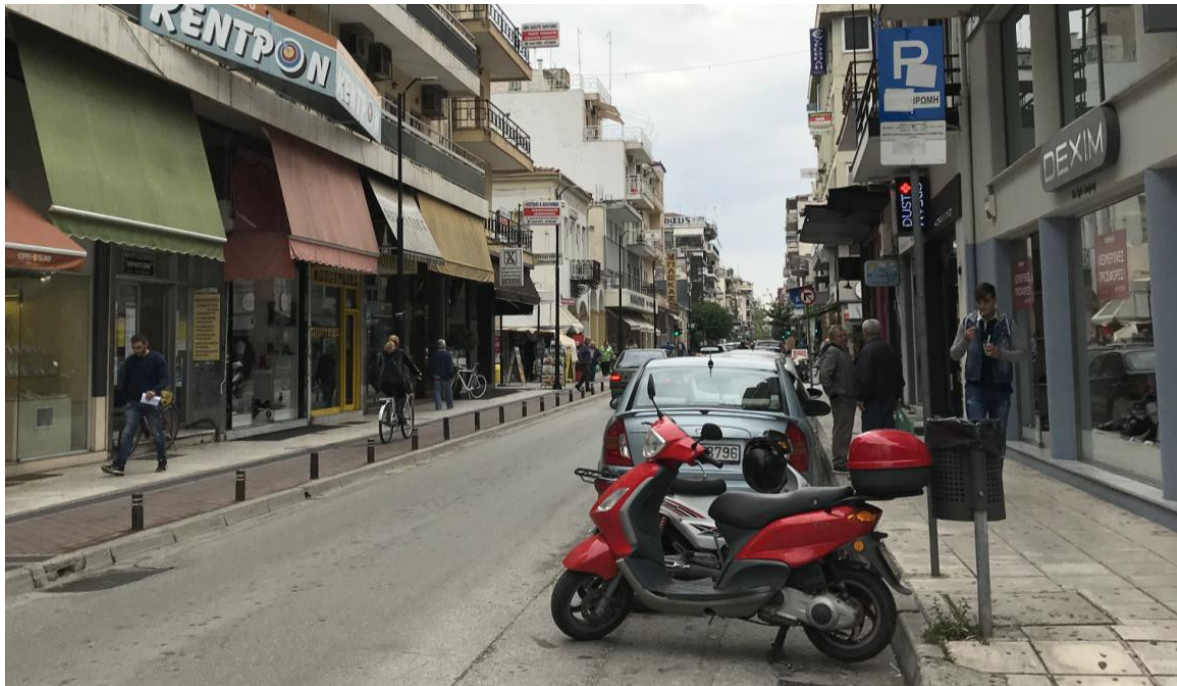
ΕΙΚΟΝΑ 18. ΥΦΙΣΤΑΜΕΝΗ ΚΑΤΑΣΤΑΣΗ ΟΔΟΥ ΥΨΗΛΑΝΤΟΥ (ΑΠΟΨΗ ΑΠΟ ΒΑΛΒΗ ΠΡΟΣ ΠΛΑΣΤΗΡΑ)

Για το λόγο αυτό, προτείνεται η εισαγωγή του φυσικού στοιχείου με τη μορφή εναέριων παρτεριών, τα οποία θα είναι αναρτημένα στους υπάρχοντες ιστούς δημοτικού φωτισμού, ενώ παράλληλα προτείνεται η αντικατάσταση των πλακών των πεζοδρομίων και η αντικατάσταση των επίσηλων κάδων απορριμάτων με νέους κυλινδρικού τύπου προκειμένου να υπάρξει μια πιο ολοκληρωμένη αισθητική αναβάθμιση στο συγκεκριμένο μέτωπο της οδού.