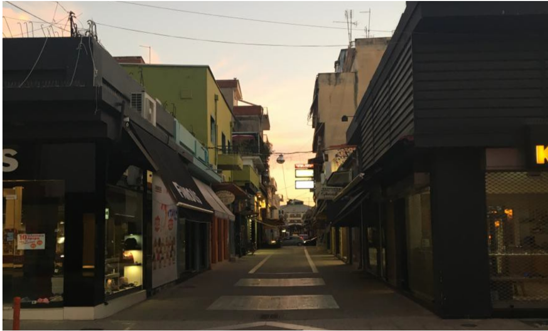
ΕΙΚΟΝΑ 5.ΥΦΙΣΤΑΜΕΝΗ ΚΑΤΑΣΤΑΣΗ ΤΟΥ ΤΜΗΜΑΤΟΣ 2 ΤΟΥ ΠΕΖΟΔΡΟΜΟΥ ΤΗΣ ΒΑΛΒΗ

Προκειμένου λοιπόν, να γίνει περισσότερο ελκυστική η διαδρομή και κατ' επέκταση να ενισχυθεί η αγοραστική κίνηση των καταστημάτων του συγκεκριμένου τμήματος, καθώς έχει άμεση χωρική σύνδεση με τον κεντρικό πεζόδρομο (Στ. Λάμπα), η πρόταση για το συγκεκριμένο τμήμα του πεζοδρόμου ακολουθεί εν μέρει τη λογική του πρώτου τμήματος. Πιο συγκεκριμένα, προτείνεται η εναέρια σύνδεση των δυο μετώπων του πεζοδρόμου με τοξοειδή κατασκευή και αυτή τη φορά με την προσθήκη του φυσικού στοιχείου. Επιπροσθέτως, ενισχύεται το τονισμός τόσο των όψεων των καταστημάτων όσο και του ίδιου του φυσικού στοιχείου, με την τοποθέτηση επιδαπέδιων χωνευτών φωτιστικών εκατέρωθεν του πεζοδρόμου αλλά και την αντικατάσταση των υφιστάμενων φθαρμένων χωνευτών φωτιστικών στο μοτίβο του δαπέδου, δημιουργώντας μια πολύ φιλική ατμόσφαιρα ιδιαίτερα κατά τις νυχτερινές ώρες, όπως απεικονίζεται και παρακάτω.