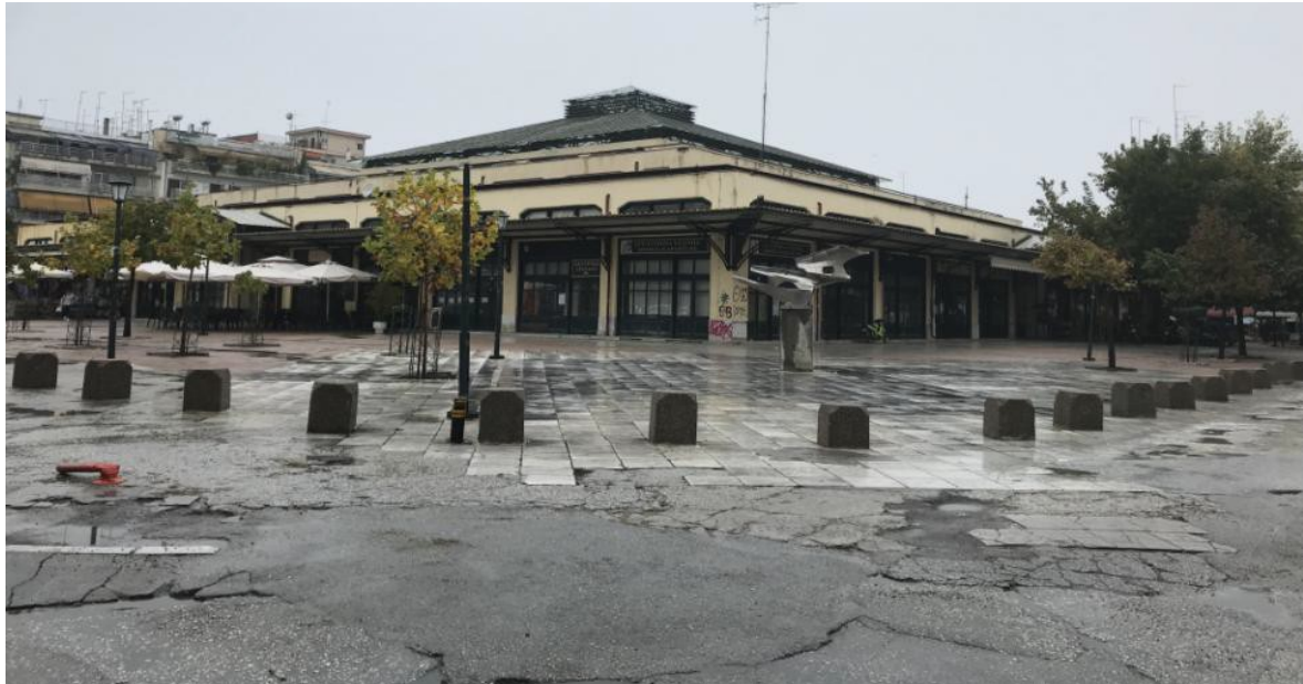
ΕΙΚΟΝΑ 26. ΝΟΤΙΟΑΝΑΤΟΛΙΚΗ ΑΠΟΨΗ ΤΗΣ ΔΗΜΟΤΙΚΗΣ ΑΓΟΡΑΣ ΚΑΙ ΤΗΣ ΠΛΑΤΕΙΑΣ

Στο τμήμα της πλατείας της Δημοτικής Αγοράς η υφιστάμενη κατάσταση παρουσιάζει μια σχετικά καλοδιατηρημένη εικόνα από την τελευταία αναβάθμισή της το 1998, εκτός από τις τμηματικές φθορές που υπάρχουν σε κάποια σημεία περιμετρικά τις πλατείας λόγω της διέλευσης βαρέων οχημάτων για λόγους φορτοεκφόρτωσης εμπορευμάτων. Για το λόγο αυτό, προτείνεται η αντικατάσταση των φθαρμένων στοιχείων κατά τόπους, προκειμένου να διατηρηθεί το μοτίβο του υφιστάμενου δαπέδου.