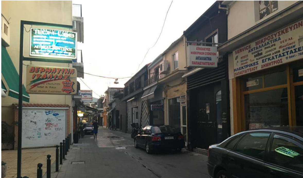
ΕΙΚΟΝΑ 7.ΥΦΙΣΤΑΜΕΝΗ ΚΑΤΑΣΤΑΣΗ ΤΜΗΜΑΤΟΣ 3 ΤΟΥ ΠΕΖΟΔΡΟΜΟΥ ΤΗΣ ΒΑΛΒΗ

Αυτό έχει ως αποτέλεσμα να είναι επιτακτική η ανάγκη αισθητικής αναβάθμισης του συγκεκριμένου τμήματος, προκειμένου να προσελκύσει τόσο περιπατητές όσο και αγοραστικό κοινό με κατεύθυνση σε άμεσες εμπορικές κατευθύνσεις.